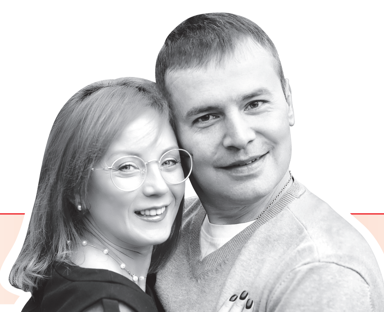
Семья, родители четырех детей